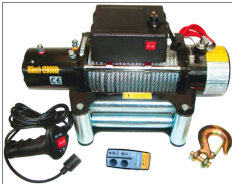
Naviják v sadě obsahuje dálkové i kabelové ovládání; lano, hák, klacky a manuál

Na dalším obrázku je vidět vložené ozubení (jak jsem již napsal, současné výrobky se ne-