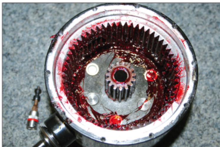
Ozubení je ocelové, vkládané do hliníkového bloku. Všude přítomnou vazelinu je nutné pravidelně doplňovat.

Je třeba si uvědomit, že ani kabelové ovládání není delší, resp. je výrazně kratší. Použitím bezdrátového ovládání pouze zajistíme bezpečnější vzdálenost od napnutého lana, ale takovou, aby měl uživatel dostatečný pře-