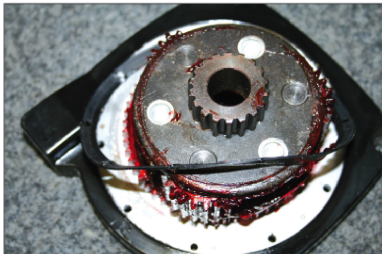
Uložení ozubených kol je v ocelových čepech, celá převodovka je rovněž z oceli

problémem je kvalita výrobků, která, pokud se odběratel o ní nezajímá, se změní hned po první dodávce zboží. Nezbyvá tedy, nežli si kvalitu zboží neustále ověřovat, jediné tak se dá zaručit. Valmont trading kvalitu hlídá nejen v dodávkách, ale řešíme ji při každém jednání s výrobcem spíše preventivně, ale řešíme. Výrobce si pak na kvalitu dává pozor, když ví, že se o ni zajímáme na prvním místě.